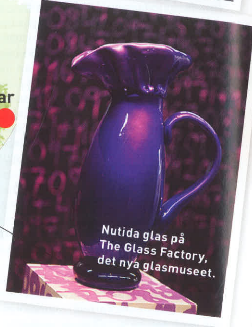
Nutida glas på The Glass Factory, det nya glasmuseet.