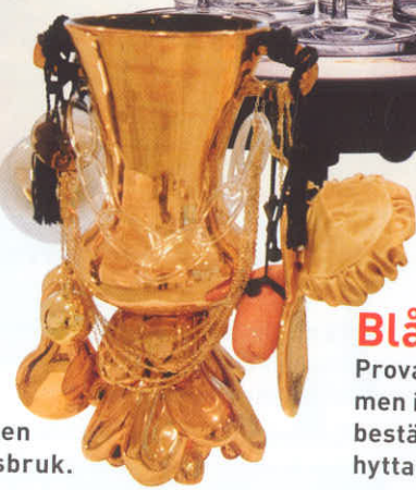
Glaspjäs av Ludvig Löfgren på Åfors glasbruk.