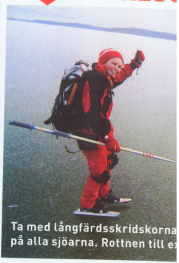
Ta med långfärdsskridskorna på alla sjöarna. Rotten till e