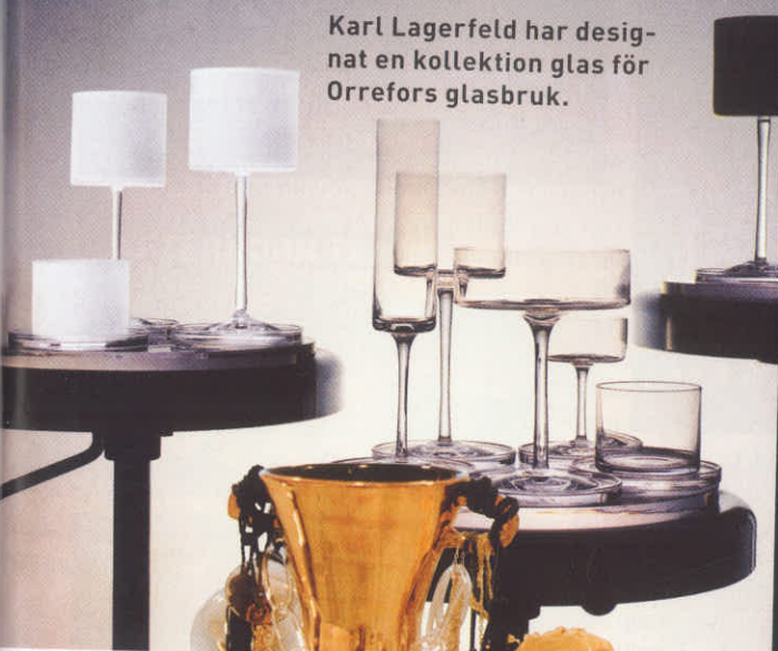
Karl Lagerfeld har designat en kollektion glas för Orrefors glasbruk.