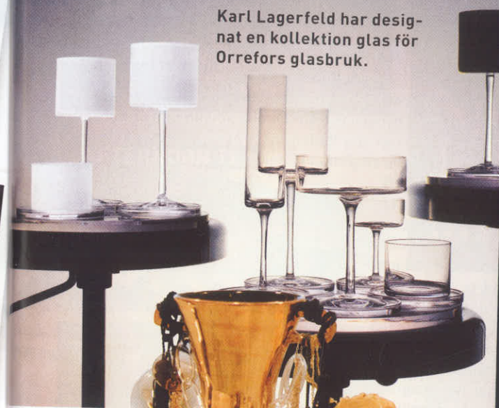
Karl Lagerfeld har designat en kollektion glas för Orrefors glasbruk.