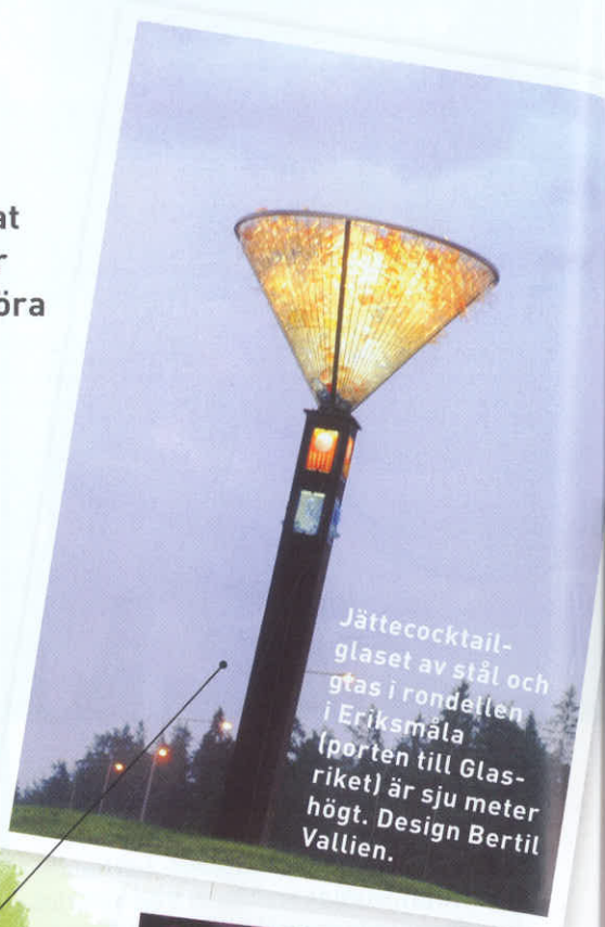
Jättecocktailglaset av stål och glas i rondellen i Eriksmåla (porten till Glasrieket) är sju meter högt. Design Bertil Vallien.