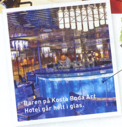
Baren på Kosta Boda Art Hotel går helt i glas.