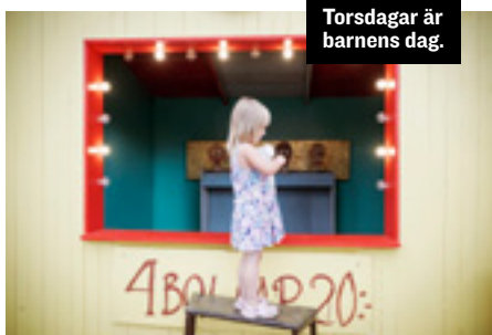
Torsdagar är barnens dag.