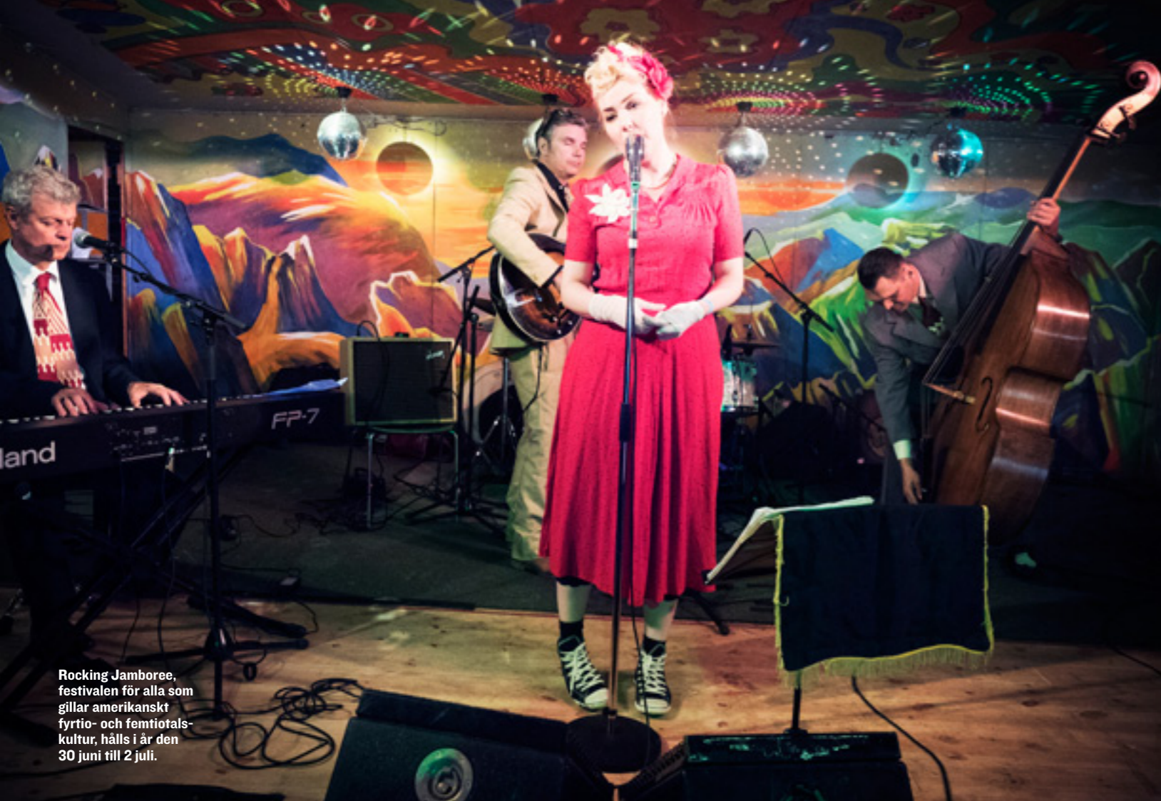
Rocking Jamboree, festivalen för alla som gillar amerikanskt fyrtio- och femtiotalskultur, hålls i år den 30 juni till 2 juli.