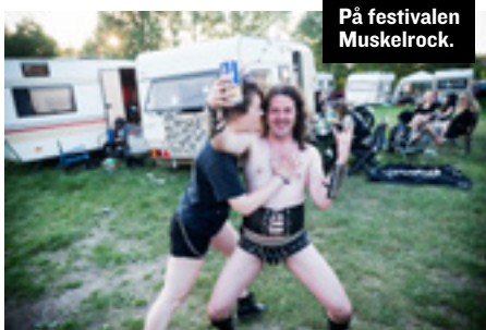
På festivalen Muskelrock.