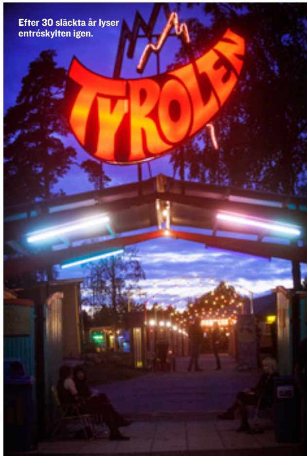
Efter 30 släckta år lyser entréskylten igen.