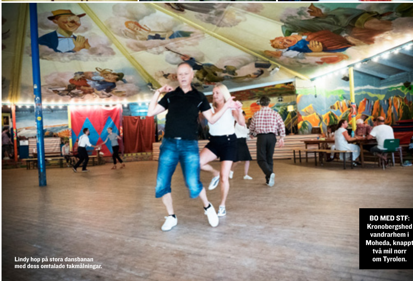
Lindy hop på stora dansbanan med dess omtalade takmålningar.