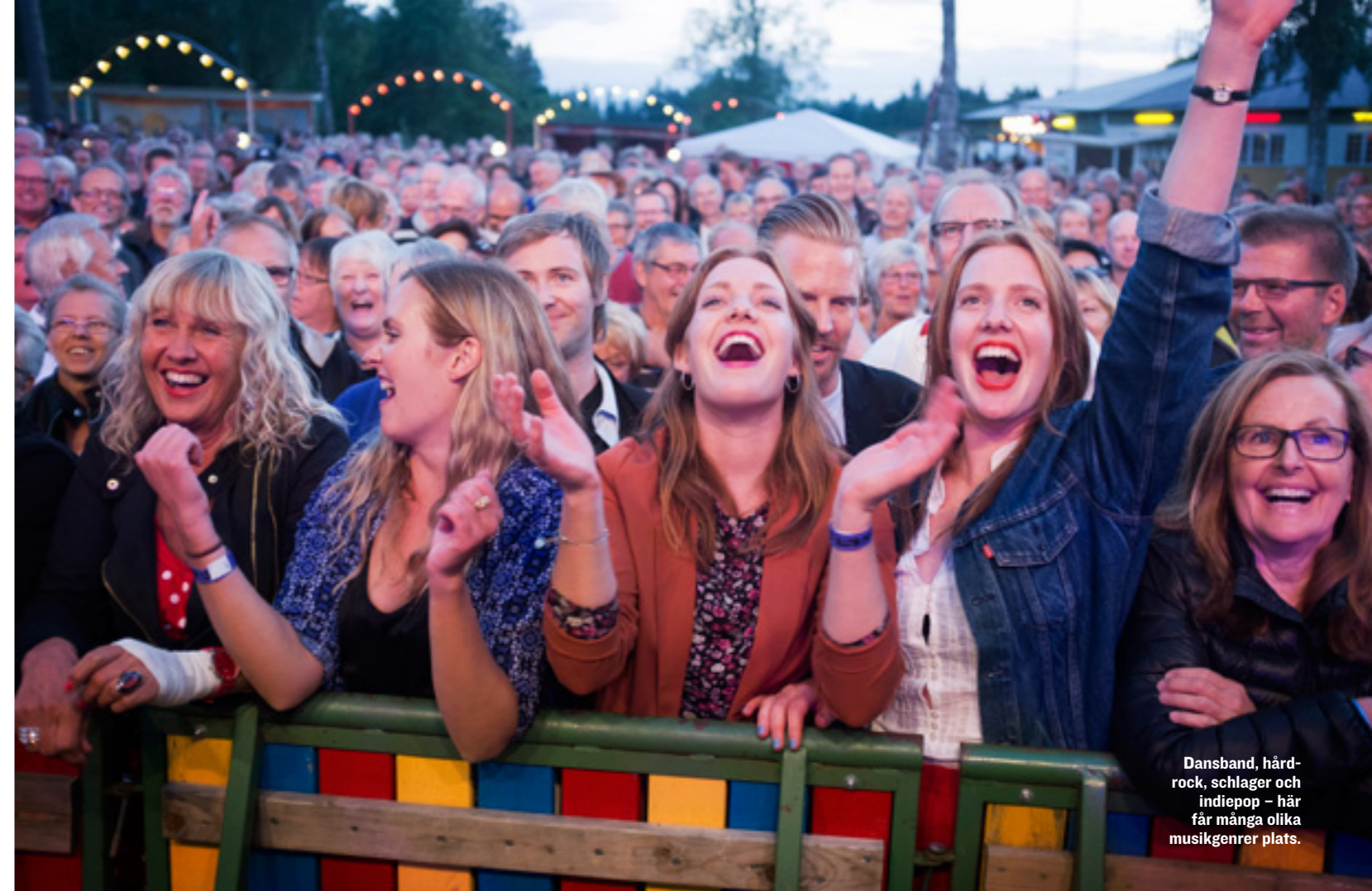
Dansband, hårdrock, schlager och indiepop – här får många olika musikgenrer plats.