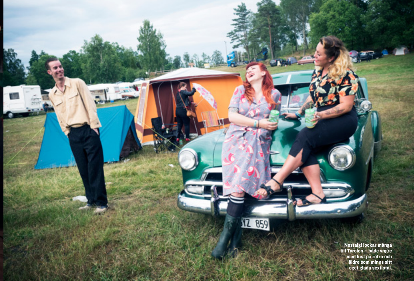
Nostalgi lockar många till Tyrolen – både yngre med lust på retro och äldre som minns sitt eget glada sextital.

parkeringen. På Stora scenen spelade landets mest populära artister, liksom internationella storheter som rockkungen Bill Haley och Little Joe från teveserien Bröderna Cartwright.